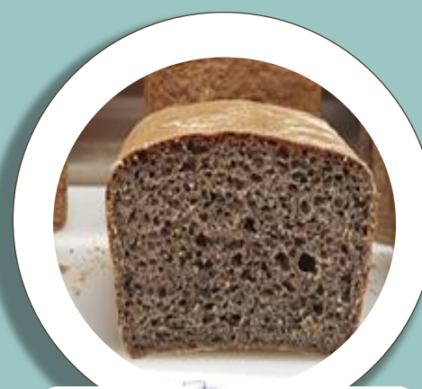
Monivilja- ja ruisleipä