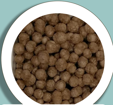
Murot ja granolat