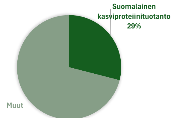
SUOMALAISTEN KULUTTAMA PROTEIINI 2023

→ Valtava potentiaali Suomen proteiiniomavaraisuuden ja huoltovarmuuden kannalta sekä myös terveellisen ravitsemuksen varmistamisessa